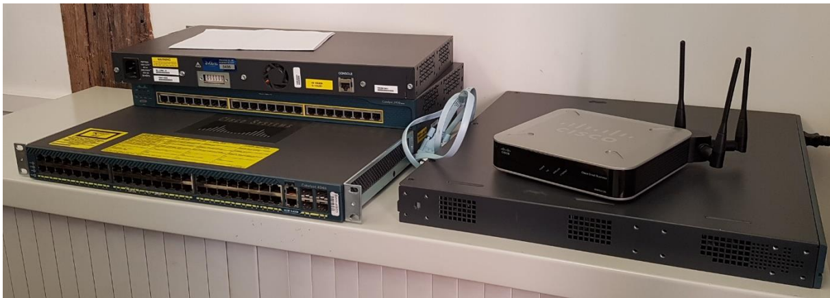
Figure 1; exemple de matériel CISCO chez Evoliris

Mais d'abord ... c'est quoi, « Cisco » ?